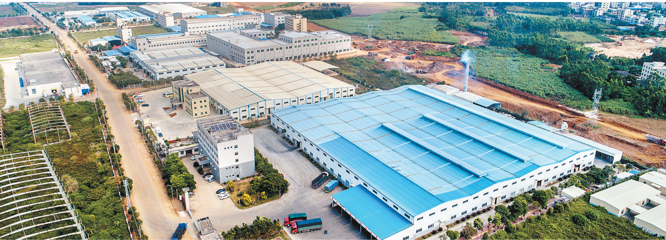
遂溪县岭北工业园区。