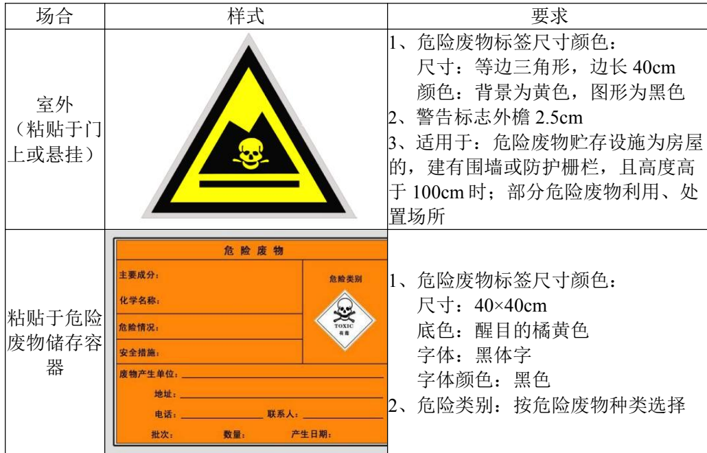
表 4-18 危废及储存容器标签示例

本项目固体废物经上述“资源化、减量化、无害化”处置后，可将固废对周围环境产生的影响减少到最低限度，不会对周围环境产生明显的影响。