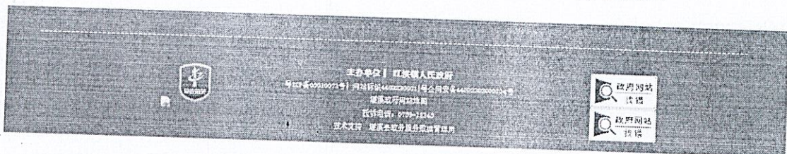
图 2.2-1 第一次网络信息公示截图