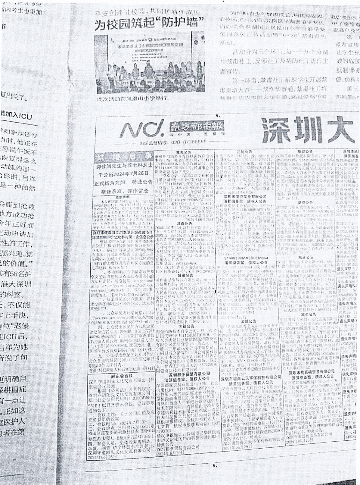
图 3.2-2 第二次报纸公示截图

本项目第二次报纸公示时间为2024年6月26日，公示报纸为《南方都市报》，第二次报纸公示截图见下图。